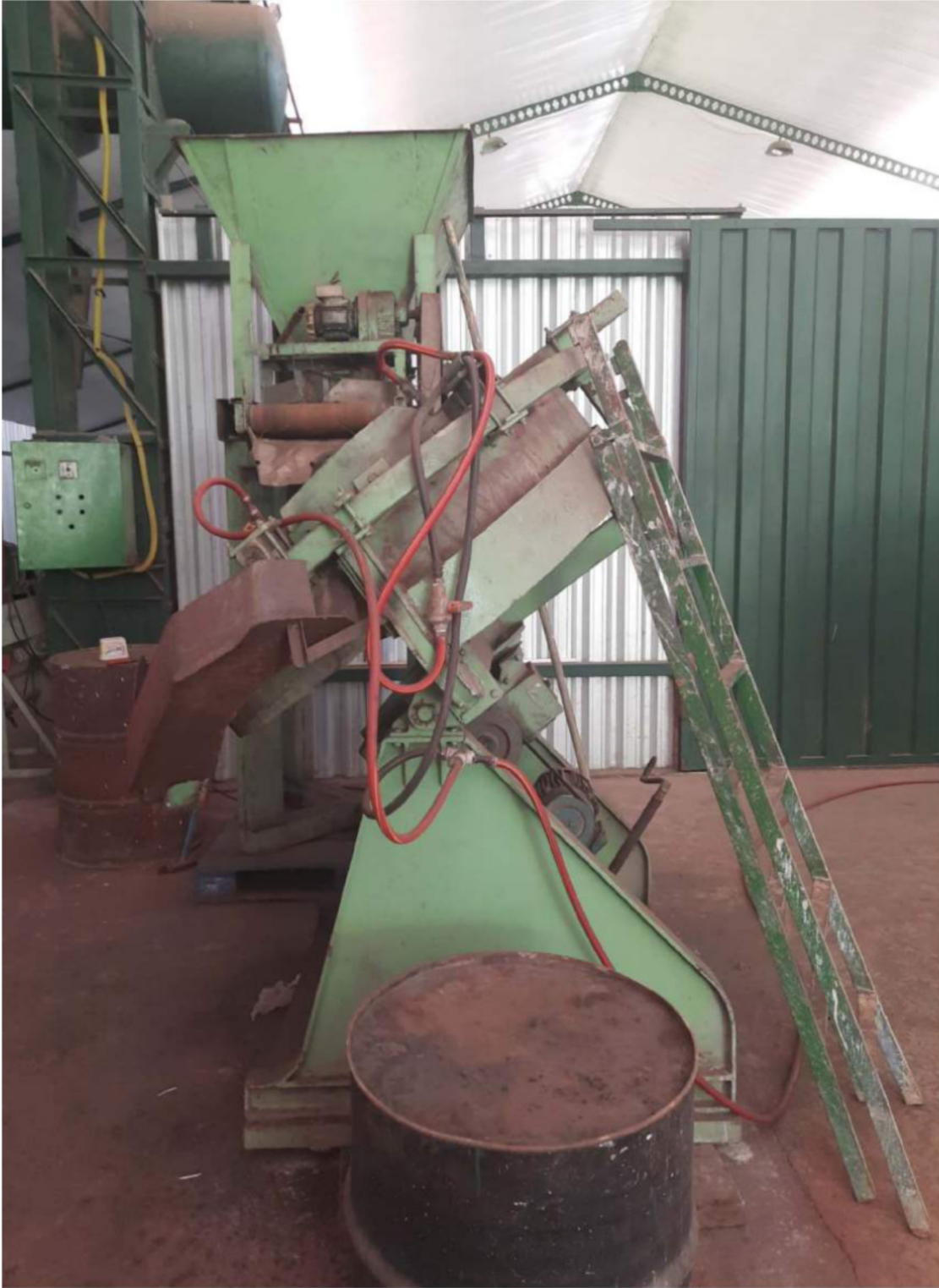
Digitalizado com CamScanner